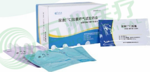
（用于幽门螺杆菌Hp感染检测）